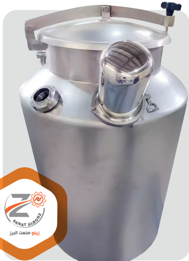
سازنده تانک pw

جنس مخازن و فیلر جوشکاری ۳۱۶L، استفاده از اتصالات کلمپی استاندارد، مخزن دارای فیلتر تنفس ۰/۲۲ میکرون، پولیش داخلی مخزن کوچکتر از ۰/۸ میکرون (Mirror)