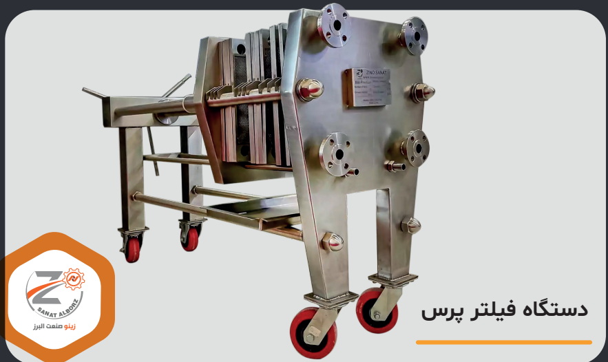
دستگاه فیلتر پرس

رعایت کامل پارامترهای طراحی رآکتور توسط شرکت زینو صنعت البرز از جمله: فشار داخلی (IP) فشار خارجی (EP) (T) و بیسکوزیته محلول، خوردگی مجاز و ... در ساخت یک رآکتور شیمیایی