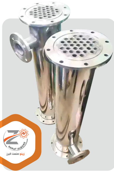
Shell & tube کندانسور

جنس مخازن و فیلر جوشکاری ۳۱۶L، استفاده از اتصالات کلمپی استاندارد، مخزن دارای فیلتر تنفس ۰/۲۲ میکرون، پولیش داخلی مخزن کوچکتر از ۰/۸ میکرون (Mirror)