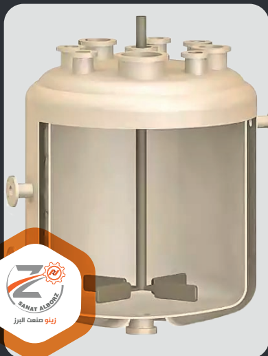
نمای داخلی دستگاه رآکتور شیمیایی

طراحی رآکتور شیمیایی نیازمند شناخت درست از واکنش شیمیایی انجام گرفته در رآکتور است و برای این منظور تسلط بر علومی چون ترمودینامیک شیمیایی، سینتیک شیمیایی و ریاضیات ضروری است.